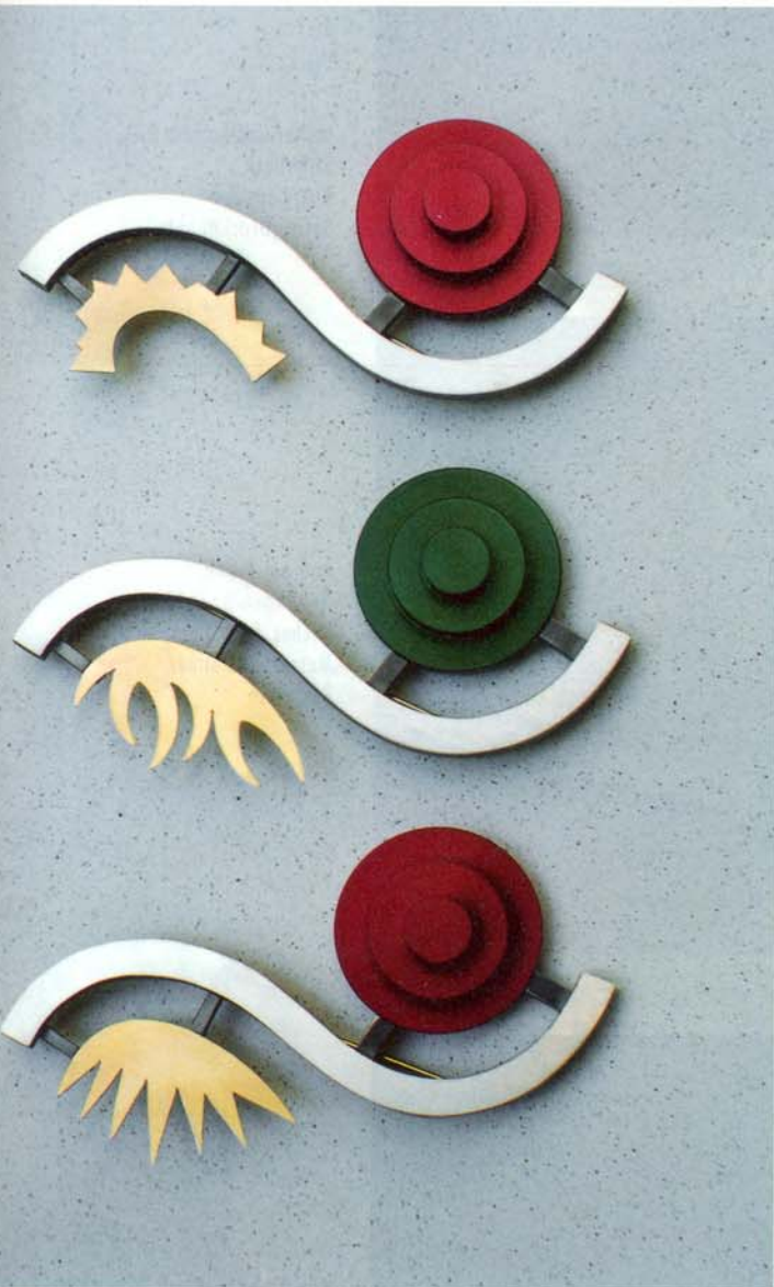
Titus Carduck, Wuppertal Broschen, 750 Gelbgold, 925 Silber, farbig eloxiertes Aluminium